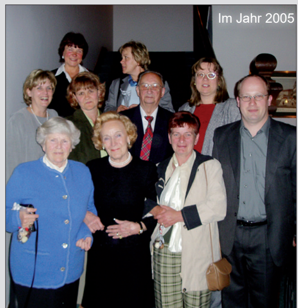
Im Jahr 2005