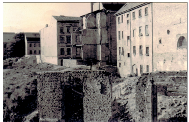
Blick aus dem Zimmer in der Berliner Gipsstraße auf die Häuserruinen, April 1956

Besatzungszonen nicht nur die Reparationen eingestellt, sondern mit dem „Marshallplan“ Finanzmittel hineingepumpt, die einen schnelleren und moderneren Aufbau der dortigen Industrie ermöglichten. Außerdem wurde eine neue Währung, die Westmark, eingeführt, die dann auch in den West-Sektoren Berlins galt. Das hatte große Auswirkungen, denn der Umtausch-Kurs war 1:5 und es gab ein großes Warenangebot. Das hieß für uns in der sowjetischen Besatzungszone und Ost-Berlin aber, dass einerseits Mangel war, weil weitere Reparationen abge-