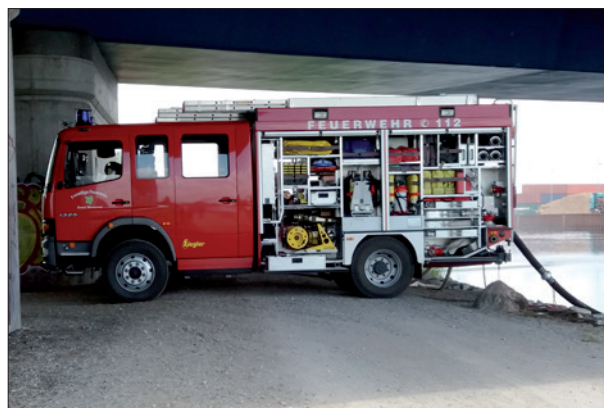
LF 16/12 am Ausbildungstag in Wustermark

Wie sagt man: „Monde und Jahre vergehen, aber ein schöner Moment leuchtet das Leben hindurch.“