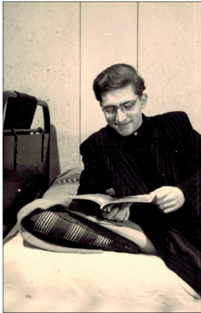
In der 1. Studentenbude in Berlin-Mitte, (W.-Pieck-Straße), bis März 1956

Bereits zwei Wochen nach Beginn des 1. Studienjahres gab es für mich eine gravierende Verbesserung: gemäß dem Vorschlag meines Lehrers erhielt ich eine der hochschuleigenen Violinen als Leihgabe für das Studium, die meine bislang gespielte eigene Geige tonlich um einiges übertraf. Nun machte das Üben und Musizieren noch viel mehr Spaß, ich konnte mithalten mit anderen Studenten, die von Hause aus ein besseres Instrument mitbrachten. Neben dem Einzel-Unterricht, wo man die Anleitung zur Erarbeitung von Studienwerken erhielt, wurden auch Werke in kleiner Besetzung, also Kammermusik, gespielt. Alle Instrumentalisten wirkten auch im Hochschul-Orchester mit und lernten viele Werke der Orchester-Literatur kennen. Das hieß natürlich üben, geduldig und hartnäckig Schwierigkeiten angehen, um den musikalischen Ausdruck der jeweiligen Werke gestalten zu können; es hieß Rat suchen, Selbstdisziplin, körperlich fit sein, eine Selbsteinschätzung entwickeln. Was man im Einzel-Unterricht gelernt hatte, konnte man so in der Praxis