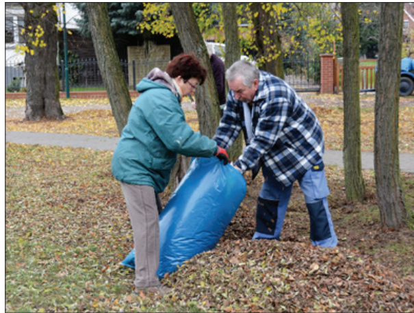
Herbstputz in Priort 2014

die Tiere nicht durch Gartenabfälle angezogen werden. In der Ortsbeiratssitzung am 20.11.2014